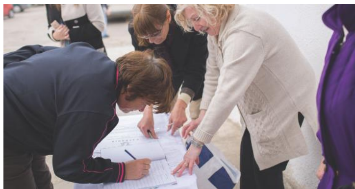
Локална акција во Свети Николе: Жените организираат петиција за достапен локален јавен превоз