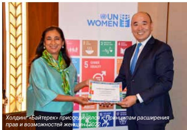
Холдинг «Байтерек» присоединился к Принципам расширения прав и возможностей женщин (2022 г.)