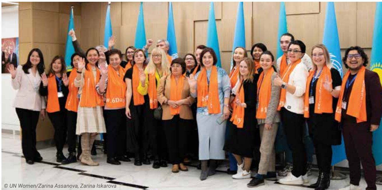
© UN Women/Zarina Assanova, Zarina Iskarova