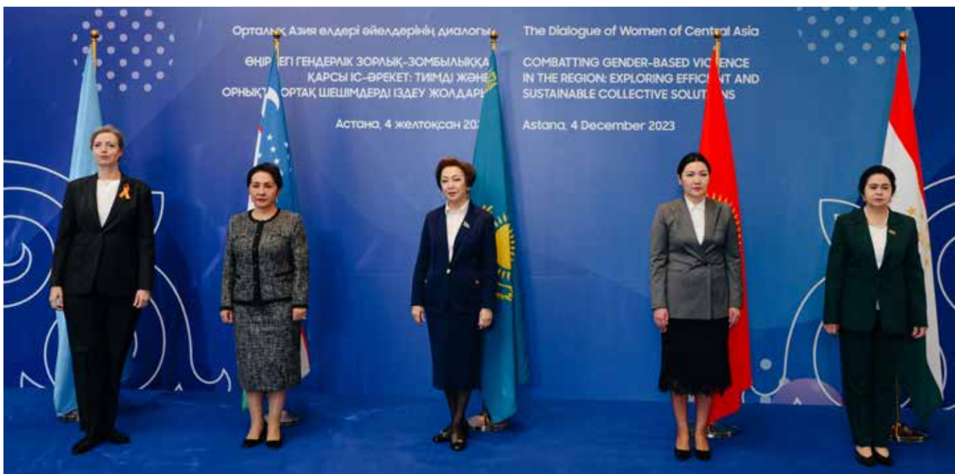
"БҰҰ-әйелдер", БҰҰ Қазақстан, ҚР Парламенті Мәжілісі