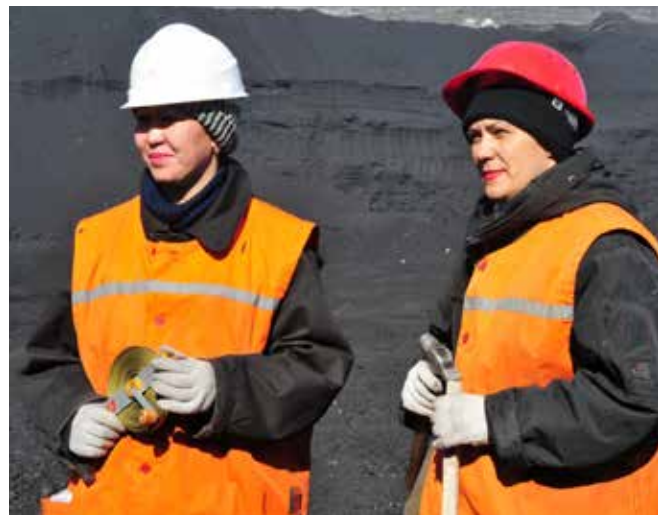
БҰҰ-әйелдер, ҚР Қорғаныс министрлігі