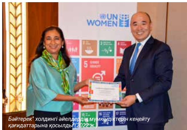
Бәйтерек» холдингі әйелдердің мүмкіндіктерін кеңейту қағидағарына қосылды (2022 ж.)