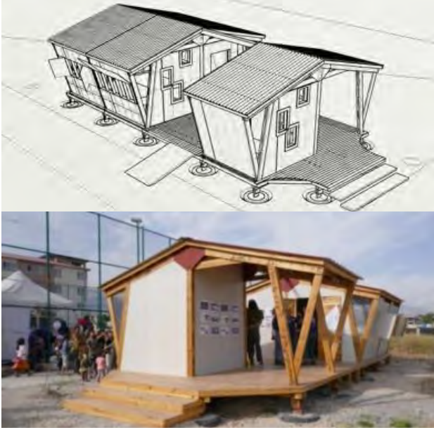
Görseller: Ahşap inşa tekniği (HiM, 2023)

Aldıkları fonla günlük bir "sofra" işlevi görecek ve çeşitli sosyal kullanımlara olanak sağlaması amaçlanan ahşap bir toplum merkezi inşa etmektedirler.