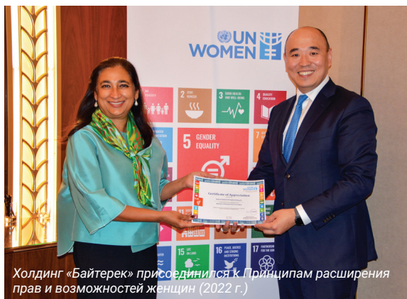
Холдинг «Байтерек» присоединился к Принципам расширения прав и возможностей женщин (2022 г.)