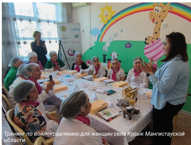
Тренинг по войлоковалянию для женщин села Курык Мангистауской области.