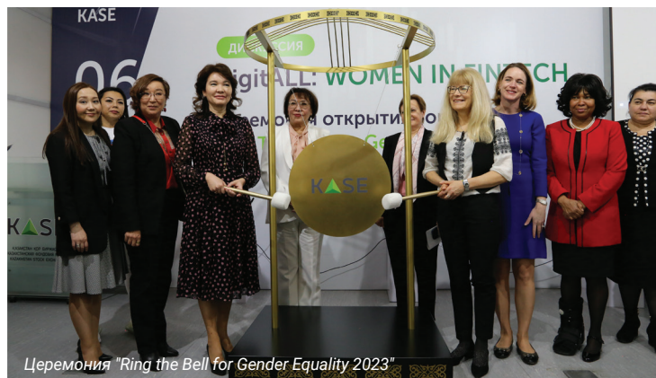
Церемония "Ring the Bell for Gender Equality 2023"