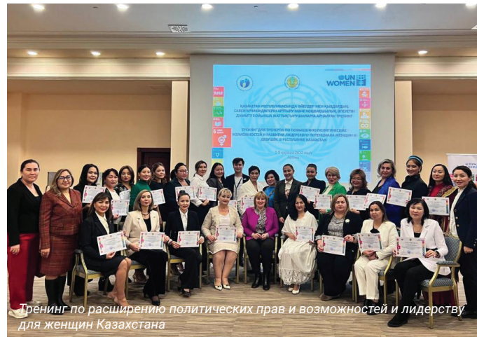
Тренинг по расширению политических прав и возможностей и лидерству для женщин Казахстана