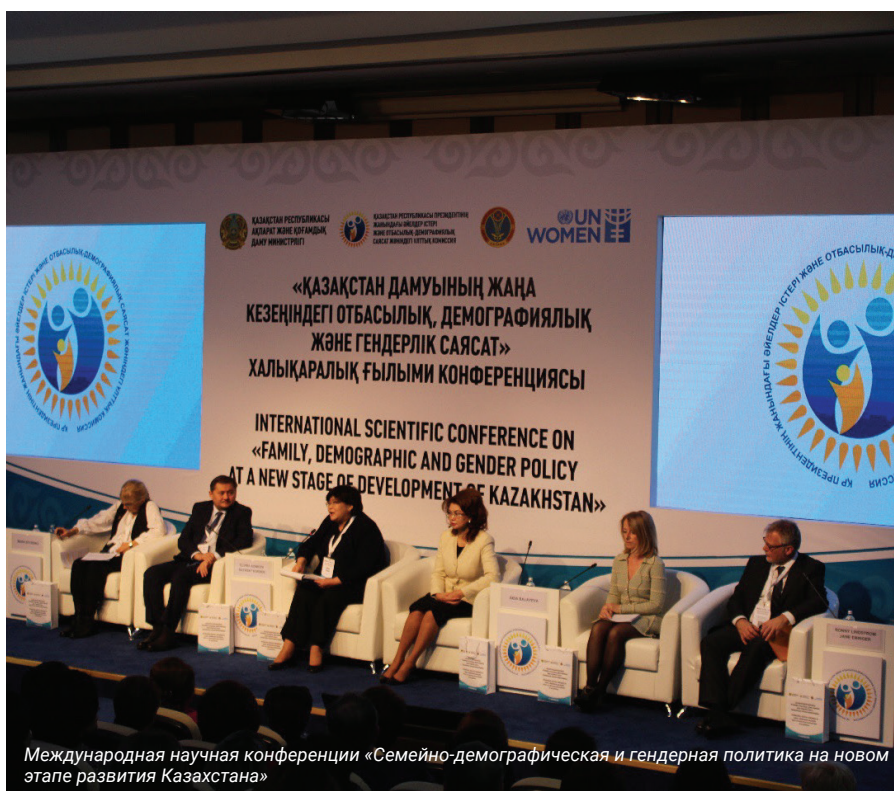
Международная научная конференции «Семейно-демографическая и гендерная политика на новом этапе развития Казахстана»