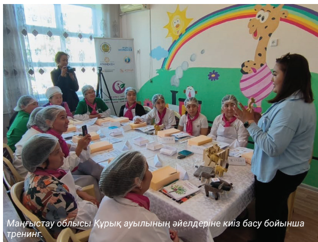
Маңғыстау облысы Құрық ауылының әйелдеріне киіз басу бойынша тренинг.