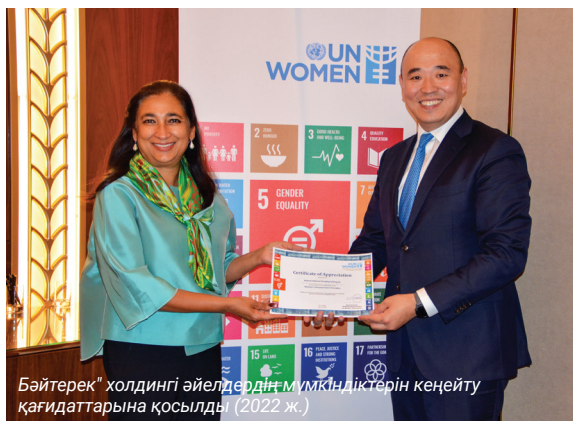
Бәйтерек холдингі әйелдердің мүмкіндіктерін кеңейту қағидаттарына қосылды (2022 ж.)