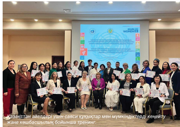
Қазақстан әйелдері үшін саяси құқықтар мен мүмкіндіктерді кеңейту және көшбасшылық бойынша тренинг.