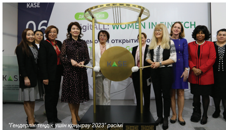
"Гендерлік теңдік үшін қоңырау 2023" рәсімі