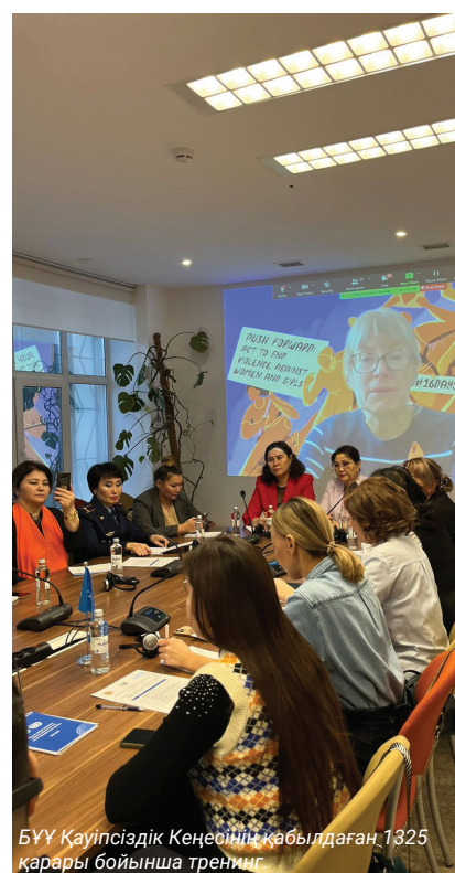
БҮҮ Қауіпсіздік Кеңесінің қабылдаған 1325 қарары бойынша тренинг.